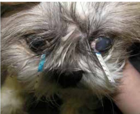
Εικόνα 5. Εκτίμηση του αποτελέσματος της δοκιμής Schirmer σε σκύλο φυλής Shih-Tzu ηλικίας 5 ετών. Δεξιός οφθαλμός: φυσιολογική μέτρηση 21 mm. Αριστερός οφθαλμός: 6 mm. Παρατηρείστε επίσης στον αριστερό οφθαλμό και άλλα συμπτώματα της ΞΚΕ (εδώ οίδημα του κερατοειδή και βλεννοπυώδες έκκριμα).

Πριν από την εξέταση η βλέννα και το έκκριμα που πιθανά υπάρχει στα βλέφαρα και τον επιπεφυκικό σάκο, απομακρύνεται ήπια αλλά χωρίς σχολαστικότητα και χωρίς έκπλυση.