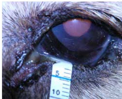
Εικόνα 6. Εκτίμηση του αποτελέσματος της δοκιμής Schirmer σε σκύλο φυλής Griffon ηλικίας 7 ετών. Αριστερός οφθαλμός μέτρηση 2mm. Παρατηρείστε επίσης άλλα συμπτώματα της ΞΚΕ (εδώ οίδημα και αγγείωση του κερατοειδή και βλεννοπυώδες έκκριμα).