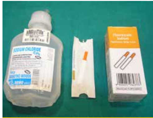
Εικόνα 7. Για τη δοκιμή της φλουορεσκεΐνης χρειάζονται ταινίες εμποτισμένες με τη χρωστική και διάλυμα φυσιολογικού ορού για την έκπλυση.