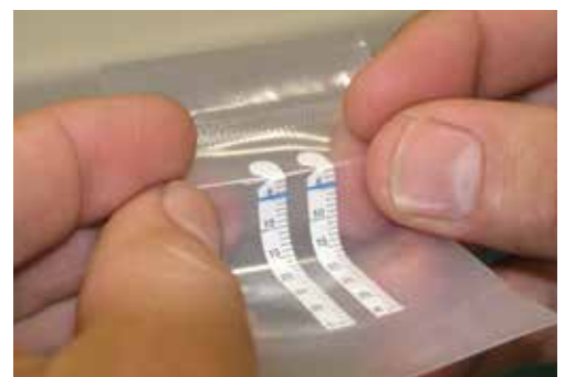
Εικόνα 2. Αρχικά και πριν το άνοιγμα του φακέλου οι ταινίες κάμπτονται στο σημείο της εγκοπής τους ώστε να διευκολυνθεί η τοποθέτησή τους στον επιπεφυκτικό σάκο και η παραμονή τους εκεί.

Διεύθυνση αλληλογραφίας: Πλακεντία Κτηνιατρική Κλινική Αλ. Παναγούλη 31 και Βοιωτίας 15343, Αγ. Παρασκευή liapis@plakentiavet.gr Τηλ.2106082309