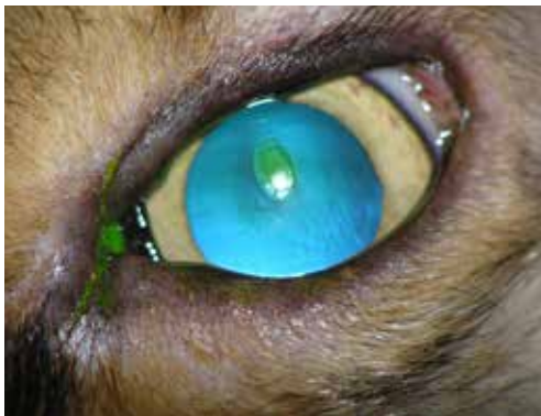
Εικόνα 11. Εκτίμηση της δοκιμής φλουορεσκεΐνης σε ημίαιμο σκύλο 9 ετών. Η χρωστική εμποτίζει κυρίως το στρώμα του κερατοειδή χιτώνα στην περιοχή του έλκους, και πολύ λιγότερο την περιφέρεια κάτω από το αποκολλημένο επιθήλιο. Εικόνα χαρακτηριστική του άτονου έλκους του κερατοειδή χιτώνα.