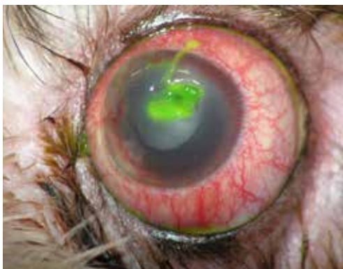
Εικόνα 13. Εκτίμηση της δοκιμής φλουορεσκεΐνης σε σκύλο φυλής Lhasa Apso 6 ετών. Η πλημμελής έκπλυση του οφθαλμού μετά την χρήση της φλουορεσκεΐνης δυσκολεύει την ακριβή εκτίμηση της βλάβης. Μια ποσότητα χρωματισμένης βλέννας δεν έχει απομακρυνθεί από το έλκος, με αποτέλεσμα το ακριβές βάθος και η έκτασή του να είναι αδύνατο να προσδιοριστούν. Εκτός αυτού ένα τμήμα της βλέννας επεκτείνεται στο άνω τμήμα του κερατοειδή χιτώνα και δίνει ψευδώς θετικό αποτέλεσμα.