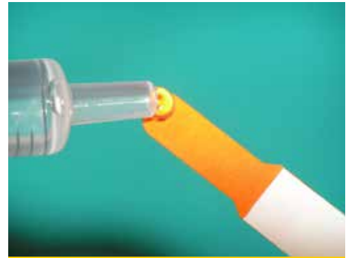
Εικόνα 8. Αρχικά το άκρο της ταινίας εμποτίζεται με μια σταγόνα διαλύματος φυσιολογικού ορού.