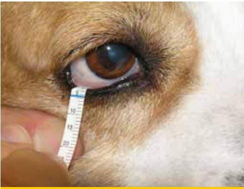
Εικόνα 3. Αρχικά η περισσότερη ποσότητα βλέννας και εκκρίματος που πιθανά υπάρχει στα βλέφαρα και τον επιπεφυκικό σάκο απομακρύνεται ήπια, χωρίς σχολαστικότητα και χωρίς έκπλυση. Κατόπιν το κάτω βλέφαρο έλκεται προς τα κάτω ώστε να εκστραφεί και το άκρο της ταινίας που έχει καμφθεί τοποθετείται στον κάτω επιπεφυκικό σάκο στο έξω μισό του βλεφάρου, ώστε το σημείο της εγκοπής να βρίσκεται στο ύψος του ελεύθερου χείλους του βλεφάρου.