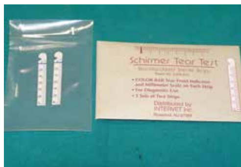
Εικόνα 1. Η δοκιμή Schirmer γίνεται με τη χρήση τυποποιημένων ταινιών διηθητικού χαρτιού διαστάσεων 5 x 35 mm που έχουν εγκοπή σε απόσταση 5 mm από το άκρο και διαγράμμιση ανά χιλιοστό και είναι αποστειρωμένες και συσκευασμένες ανά δυο. Μερικές ταινίες (όπως αυτές της φωτογραφίας) είναι διαποτισμένες με χρωστική στο ύψος της εγκοπής για την ευκολότερη ανάγνωση του αποτελέσματος.

Με τη δοκιμή Schirmer ελέγχεται η παραγωγή της υδάτινης φάσης των δακρύων. Κατά συνέπεια χρησιμοποιείται για τη διάγνωση της ξηρής κερατοεπιπεφυκίτιδας (ΞΚΕ) και ειδικότερα της ΞΚΕ ποσοτικού τύπου. Η διάγνωση της ποιοτικού τύπου ΞΚΕ γίνεται με άλλες εξετάσεις. Στην κλινική πράξη εφαρμόζεται η δοκιμή Schirmer I η οποία γίνεται χωρίς τοπική αναισθησία και η οποία