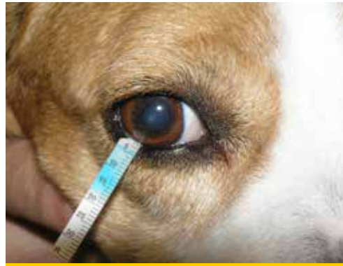
Εικόνα 4. Το κάτω βλέφαρο αφήνεται να επανέλθει στη θέση του παρασύροντας και την άκρη της ταινίας. Στα ζώα που η ταινία συγκρατείται δύσκολα στη θέση αυτή, τα βλέφαρα μπορούν να συγκρατηθούν κλειστά κατά τη διάρκεια της εξέτασης χωρίς να αλλοιωθεί το αποτέλεσμα. Η ταινία αφήνεται στη θέση αυτή για ένα λεπτό και κατόπιν αφαιρείται. Η εκτίμηση του αποτελέσματος πρέπει να γίνεται αμέσως γιατί η αύξηση της διαβροχής της ταινίας μπορεί να εξακολουθήσει για λίγο.

υπολογίζει τόσο τη βασική όσο και την αντανάκλαστική έκκριση των δακρύων. Οι φυσιολογικές τιμές στη δοκιμή Schirmer κυμαίνονται από 18,64 \pm 4,47 mm /min έως 23,90 \pm 5,12 mm /min στον ενήλικο σκύλο και από 14,3 \pm 4,7 mm/min έως 16,92 \pm 5,73 mm/min στην ενήλικη γάτα στην οποία πάντως η ΞΚΕ είναι σπανιότερη. Στο σκύλο μέτρηση μικρότερη των 5 mm δηλώνει σοβαρής μορφής ΞΚΕ. Μέτρηση 5-10 mm δηλώνει ΞΚΕ ενώ 10-15mm θέτει υπόνοια για τη νόσο και πρέπει να συνεκτιμάται με τα άλλα κλινικά συμπτώματα.