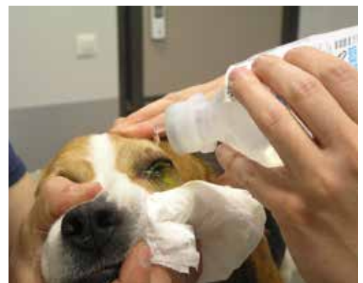
Εικόνα 10. Ακολουθεί άφθονη έκπλυση της επιφάνειας του κερατοειδή και του επιπεφυκτικού σάκου προκειμένου να απομακρυνθεί η περίσσεια της χρωστικής. Σε αντίθετη περίπτωση η παραμονή της φλουορεσκεΐνης σε προσκολλημένη βλέννα, τρίχες και άλλα συγκρίματα μπορεί να οδηγήσει σε ψευδώς θετικά αποτελέσματα.